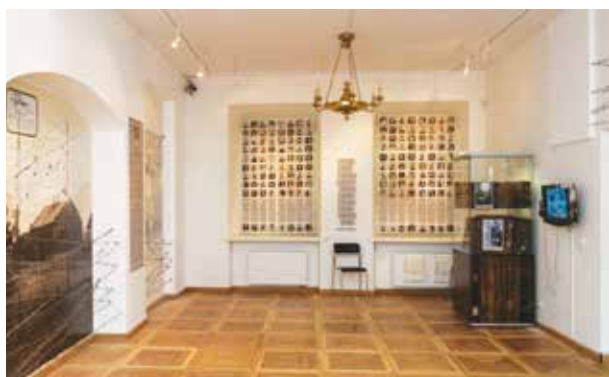
3. Fragmentas iš parodos Kauno žydai istorijos šaltiniuose , 2014, Kauno miesto muziejus, Giedrės Jankauskienės nuotrauka

A fragment from the exhibition Kaunas Jewish community in the history sources , 2014, Kaunas city museum