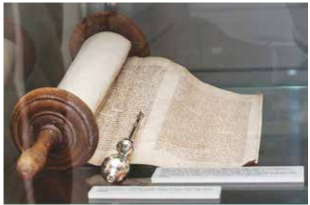
4. Fragmentas iš parodos Kauno žydai istorijos šaltiniuose , 2014, Kauno miesto muziejus

A fragment from the exhibition Kaunas Jewish community in the history sources , 2014, Kaunas city museum