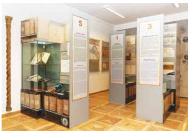
1. Fragmentas iš parodos Kauno žydai istorijos šaltiniuose , 2014, Kauno miesto muziejus

A fragment from the exhibition Kaunas Jewish community in the history sources , 2014, Kaunas city museum