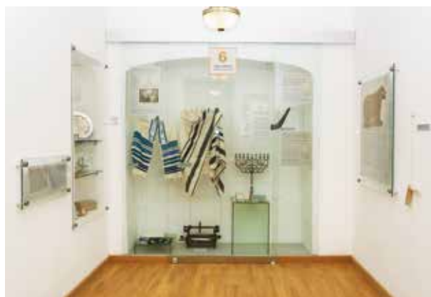
2. Fragmentas iš parodos Kauno žydai istorijos šaltiniuose , 2014, Kauno miesto muziejus

A fragment from the exhibition Kaunas Jewish community in the history sources , 2014, Kaunas city museum